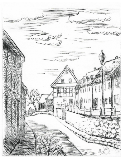
I-1/2 Neustadt/MW D. Linke

Danach wird auf die Platte Druckfarbe aufgetragen und später wieder abgewischt. In der Rille bleibt die Farbe haften.